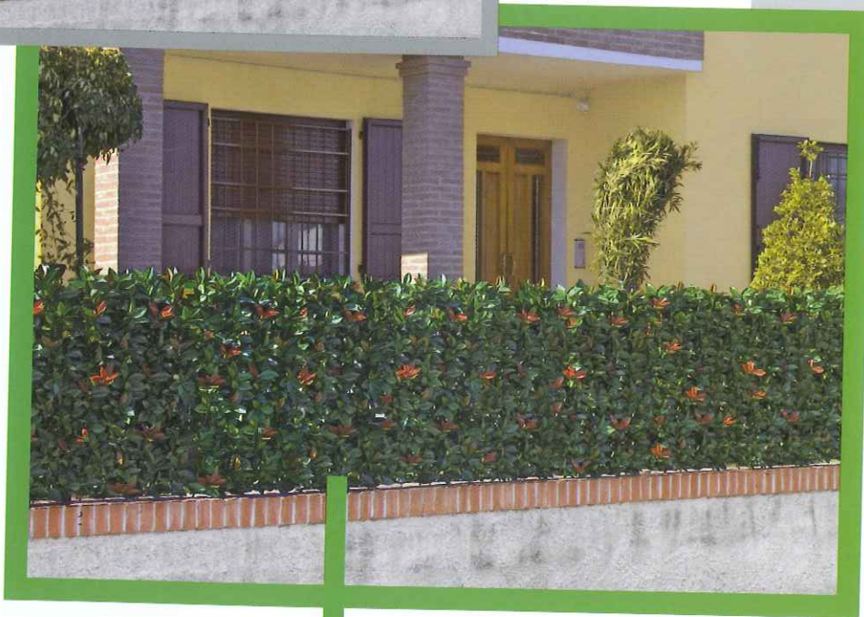
Photinia Vir 0002